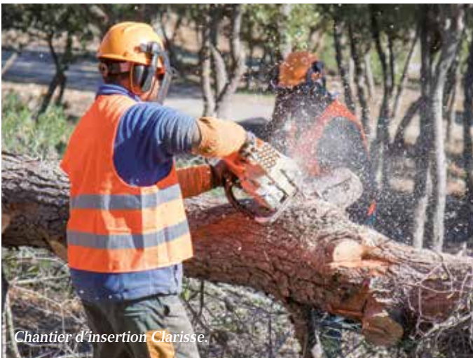
Chantier d'insertion Clarisse

Le Malmont est donc dès l'origine de Draguignan un lieu commun de partage. L'équipe municipale souhaite perpétuer cet usage et l'amplifier. C'est un poumon vert qui mérite d'être valorisé et qui fait partie intégrante de la richesse patrimoniale de Draguignan.