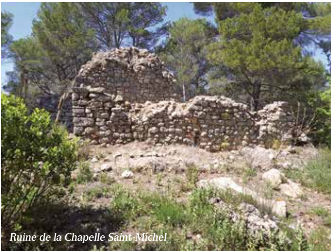
Ruine de la Chapelle Saint-Michel