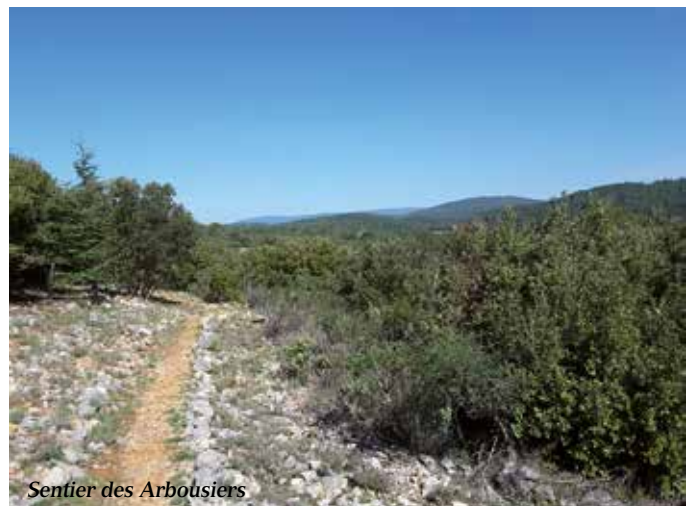
Sentier des Arbousiers

Au XIV e et XV e siècle, les Consuls de Draguignan qui gèrent cette partie du massif le divisent en lots pour en faire des coupes de bois. Les promeneurs avertis peuvent encore aujourd'hui trouver des vestiges de cette activité avec la présence de nombreuses charbonnières dissimulées aux milieux des chênes verts.